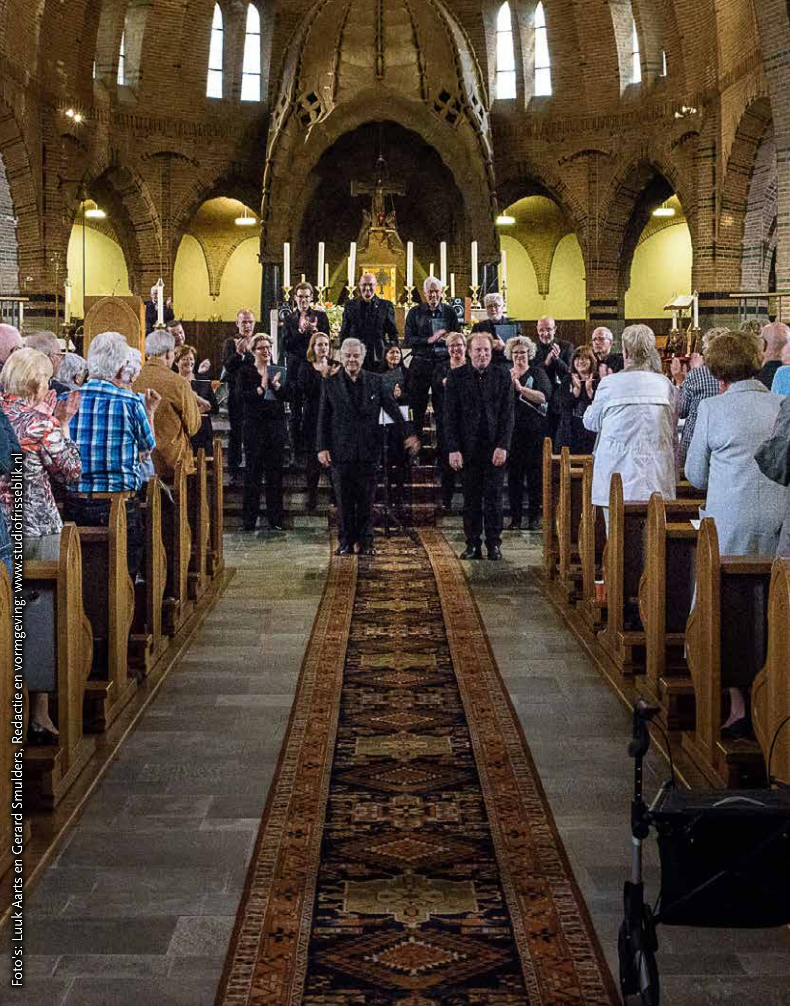
Redactie en vormgeving: www.studiofrisseblik.nl