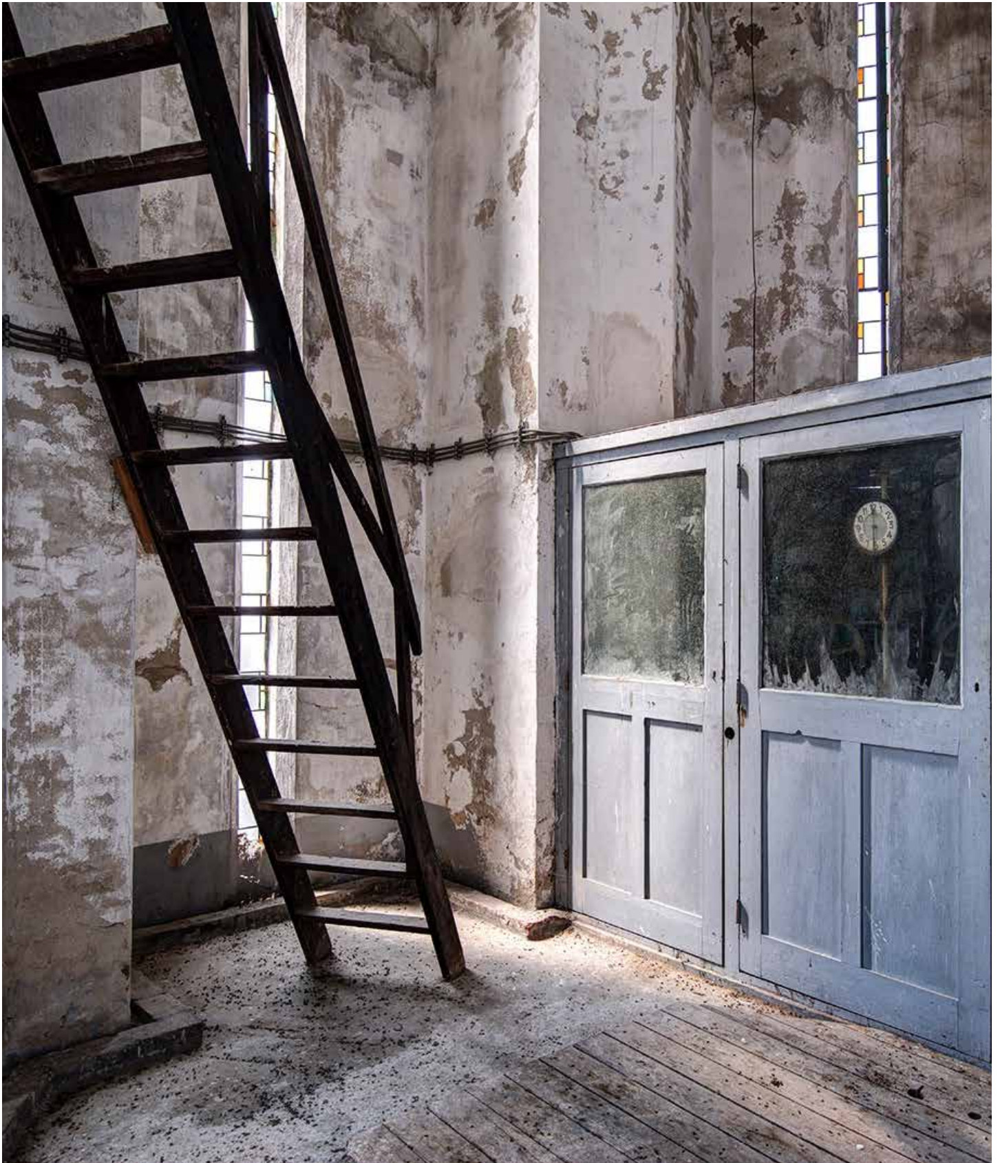
De foto toont een torenetage waarop een regelkast te zien is met elektrische apparatuur voor het prachtige, in Nederland unieke zeskantige torenuurwerk. Na de restauratie zullen alle zes de wijzerplaten, mooi verlicht, weer de juiste tijd aangeven.